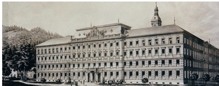
Abbildung 1: Bischofliches Gymnasium Petrinum nach der Fertigstellung