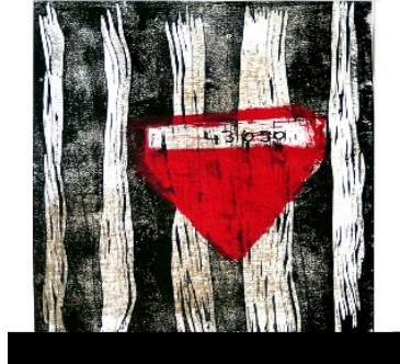
Abbildung 5: Schutzhäftling Nr. 43050

Nachdem man Gruber ins KZ Mauthausen deportierte, wurden am 16. August 1940 Häftlinge und Geistliche in einem Viehtransporter ins KZ Gusen überstellt. So wurde auch Gruber als „Schutzhäftling Nr. 43050“ nach Gusen transportiert.