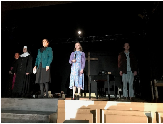
Abbildung 9: blindes Mädchen in der Mitte

Musik von Peter Androsch und Ton und Lichteffekte von „Viteka & Lorenz OG“ sehr schnell verstrichen. 87