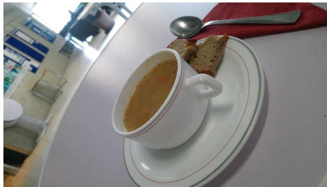
Abbildung 13: Gruber-Suppe heute