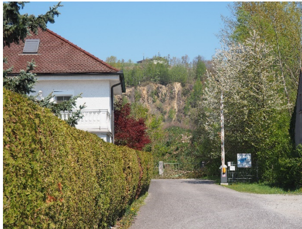
Abbildung 11: Von der Siedlung aus, kann man den Steinbruch noch erkennen.

Minuten lang mithilfe von Kopfhörer durch die Siedlung und die gesamte KZ-Landschaft geführt. Man hört Berichte ehemaliger Häftlinge, der Bewohner und SS-Angehörigen. Der Audioweg lässt einem sehen, was nicht mehr zu sehen ist. Die schrecklichen Zustände im KZ werden sehr genau beschrieben; es ist fast so, als wäre man in die 1940-er gereist.