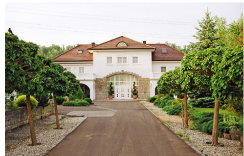
Abbildung 8: Das Jourhaus heute, ein Landhaus