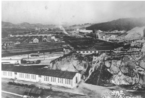
Abbildung 4: Das Konzentrationslager Gusen

25. Mai 1940 eröffnete man das Lager in St. Georgen an der Gusen und es umfasste circa 350 mal 150 Meter. Damals setzte sich das KZ aus drei Lager zusammen: Gusen I, II und III. In St. Georgen gab es auch unterirdische Stollen, in denen Waffen hergestellt wurden und von dort nach Steyr geliefert wurden (Projekt „Bergkristall“). 54