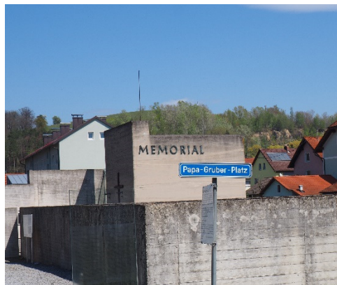
Abbildung 12: Papa-Gruber-Platz

Zu Ehren Grubers, wurde der Vorplatz, an dem die Gedenkfeiern immer stattfinden, „Papa-Gruber-Platz“ genannt.