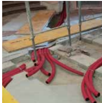
Lehrverrohrung für die Elektrik