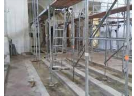
Gerüst für die Einhausung

In der letzten Juliwoche haben die Gerüstbauer das alte Gerüst abgebaut und ein neues Gerüst errichtet. Dieses Gerüst wurde mit Planen bespannt, um das unbewegliche Kunstgut, die Altäre etc. vor Staub zu schützen. Der Baumeister führte die Stemm-, Grab- und Verputzarbeiten durch. Der Elektriker hat die Elektroinstallation verlegt. Der Steinmetz restauriert und erneuert jetzt das Pflaster, was ihn bis Mitte Oktober beschäftigen wird.