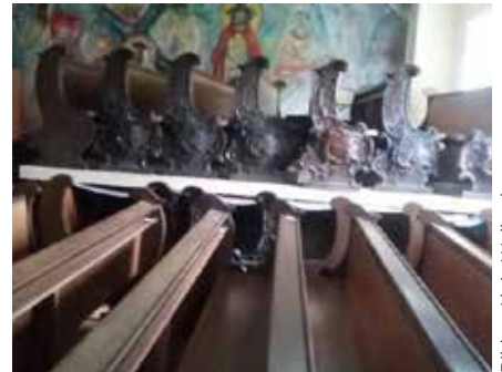
Kirchenbänke in der Wochentagskapelle