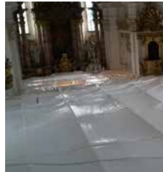
Einhausung vom Chor aus gesehen