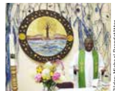
Bilder: Michael Brandstätter

MITTWOCH – ein Wochentag wie jeder andere, und doch beginnt der Tag für manche anders. Dann, wenn sie sich auf den Weg machen in den Subener Pfarrsaal, dorthin, wo derzeit die Mittwochsgottesdienste stattfinden. Pfarrer Juventus erwartet jeden Besucher mit einem fröhlichen Lachen. Gemeinsam in kleiner Runde zu feiern ist schön, es ist Platz für manch persönliches Gespräch, man fühlt sich wahrgenommen, man ist angenommen, mit allem was eine/r so mitbringt. Gerne wird auch im Anschluss an den Gottesdienst der Weg zu „Bäcker Gabi“ eingeschlagen, wo in geselliger Runde gefrühstückt wird.